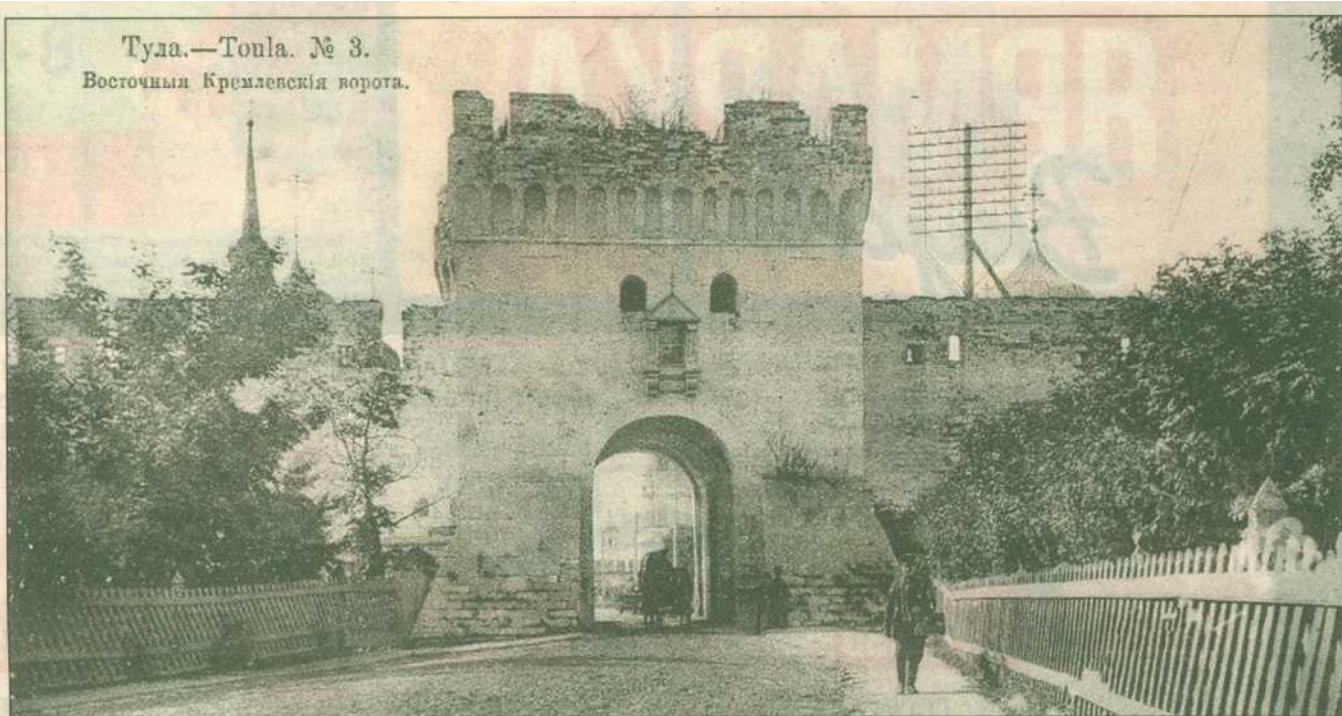
На старых открытках башня Никитских ворот называлась Ивановскими воротами. А на открытках советского довоенного периода еще проще - Башней кремля со входом на стадион Никитские ворота, но уже как Восточные ворота кремля.

выходили к Казанской церкви, и была произведен осмотр внутреннего помещения с каменными сводами под этой башней. Помещение оказалось довольно вместительным, приблизительно в 3 кубических сажени. По стенам стояли деревянные полки, на которых размещались старинные разрывные чугунные снаряды - всего 31 штука. Причем некоторые из них, вероятно, оставались заряженными, так как в них были вставлены фитили.